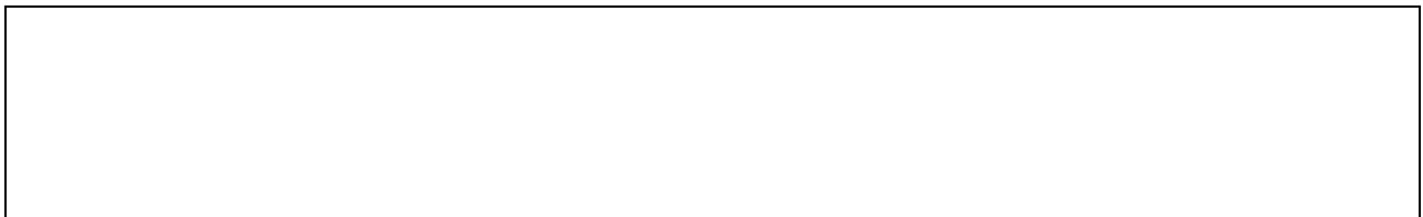
Схема споруди робиться на вклейці до бланка № 11

На поздовжньому та поперечному розрізах відображаються також лотки, штольні, шахти, а в необхідних випадках – окремі схеми дренажних проходок.